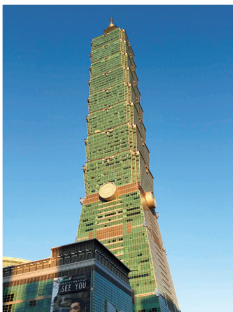
写真1 台北のランドマーク台北101