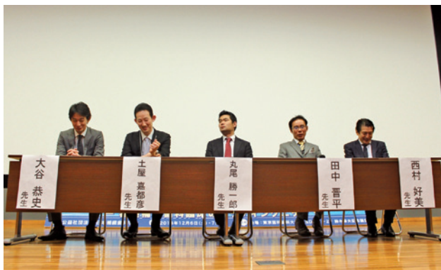
シンポジウム4シンポジストの先生方