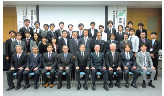
大会運営スタッフ