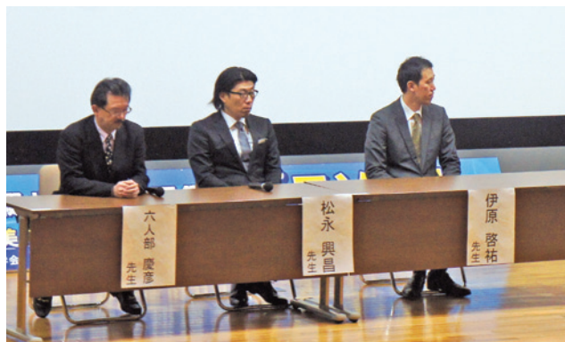
シンポジウム3シンポジストの先生方

最後のセッションである、シンポジウム4「CAD/CAMを用いた審美材料と技工技術の進歩」(座長:萩原芳幸先生(日本大学)、前川賢治先生(岡山大学))ではCAD/CAMを用いた補綴治療を成功に導くための方策と現状における問題点について議論が行われた。大谷恭史先生(ワシントン州シアトル開業)による「Digital Dentistryの現状と未来—補綴材料の選択、補綴設計および最新技術について—」ではCAD/CAMにより補綴装置を作製する際の材料選択基準および補綴装置の設計について考察頂くとともに、新しいDigital Dentistryとしてロボティクスに関してもご説明頂いた。土屋嘉都彦先生(九州支部、福岡歯科大学)によ