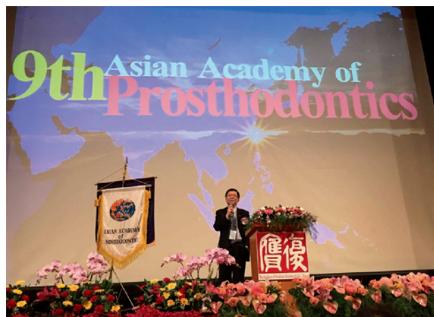
写真2 9thAAP 開会式