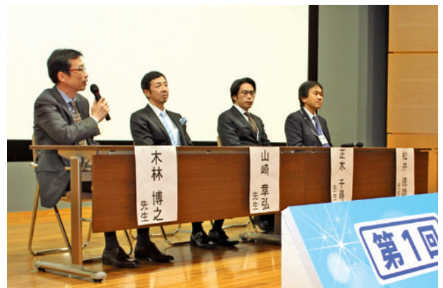
シンポジウム2 シンポジストの先生方