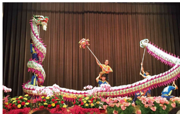
写真3 オープニングセレモニーで披露された中華獅子舞