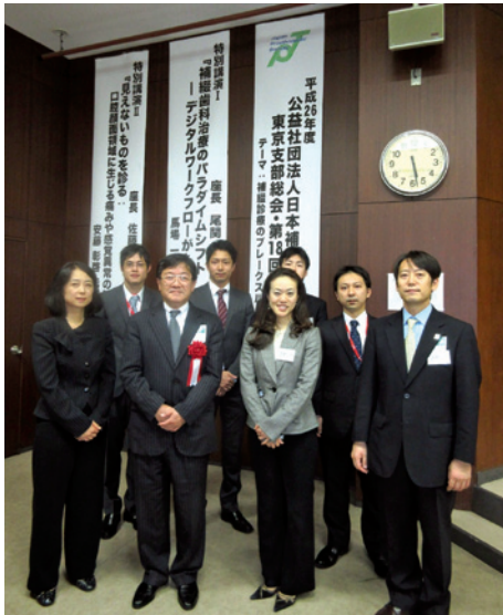
大会運営(昭和大学歯学部インプラント歯科学講座)

総会では第19回学術大会が東京医科歯科大学の主幹で開催されることが承認されました。学術大会終了後には昭和大学入院棟17階タワーレストランにおい