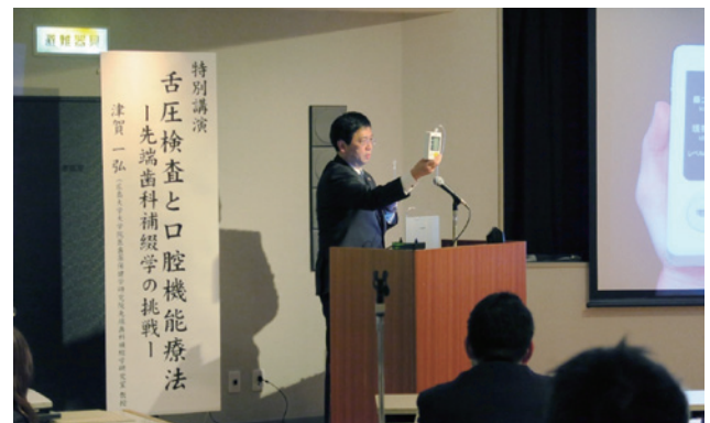
特別講演:舌圧測定器と津賀一弘教授(広島大学)